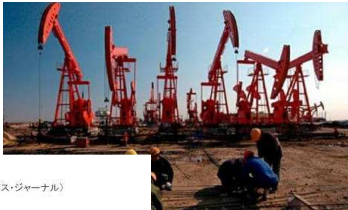
原油確認埋蔵量 (10億バレル、2014年、オイル&ガス・ジャーナル)